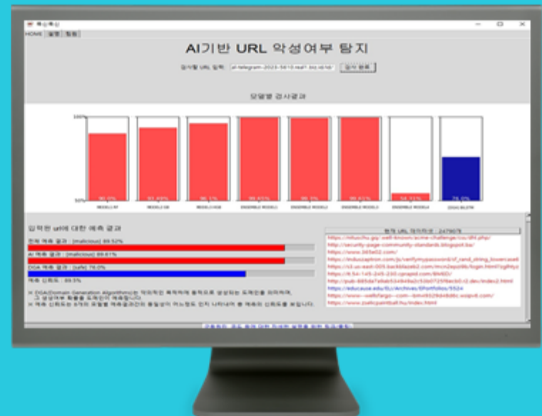
GUI 서비스 화면