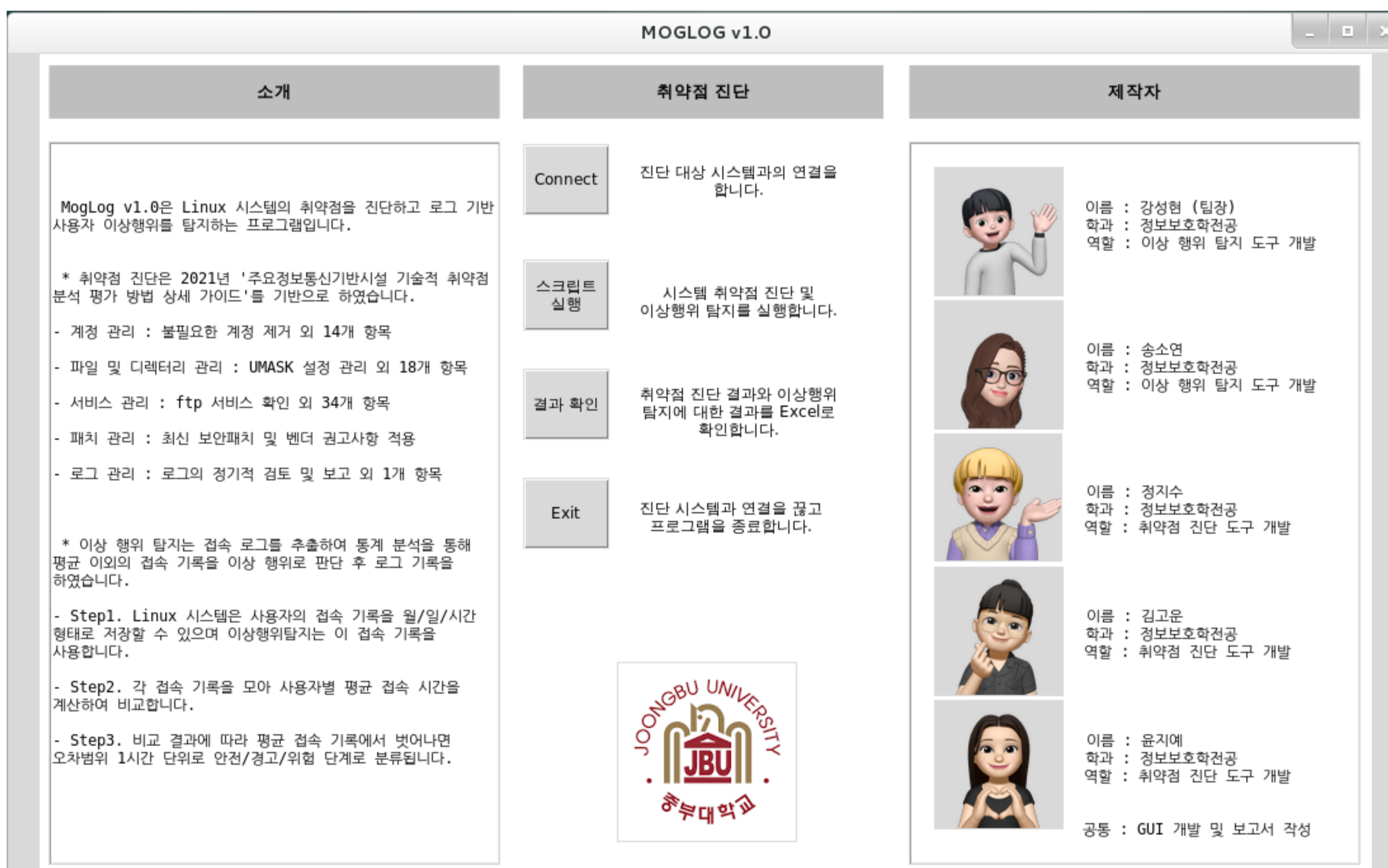
프로그램 GUI 모습