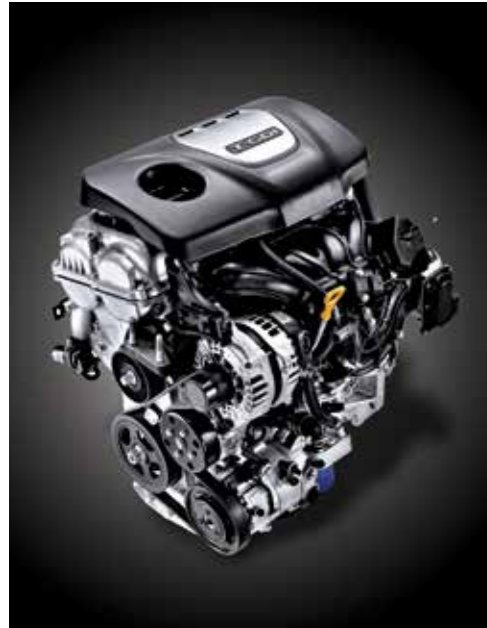
가솔린 1.6 터보 엔진(204마력)

고마력 가솔린 1.6 터보 엔진의 파워와 후륜 멀티링크 서스펜션의 안정감, 대용량 디스크 브레이크의 제동력이 선사하는 퍼포먼스로 당신의 드라이빙은 더욱 완벽해집니다.