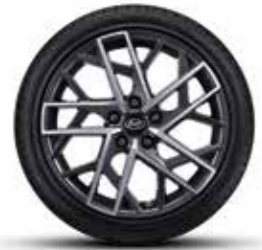
225/40R18 타이어 & 18인치 알로이 휠