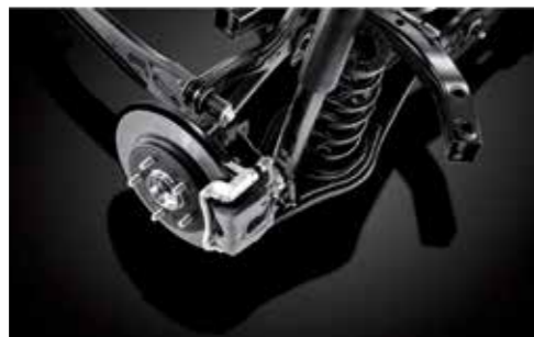
대용량 디스크 브레이크 / 후륜 멀티링크 서스펜션