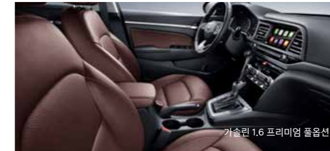
가솔린 1.6 프리미엄 풀옵션