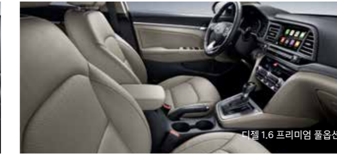
디젤 1.6 프리미엄 풀옵션