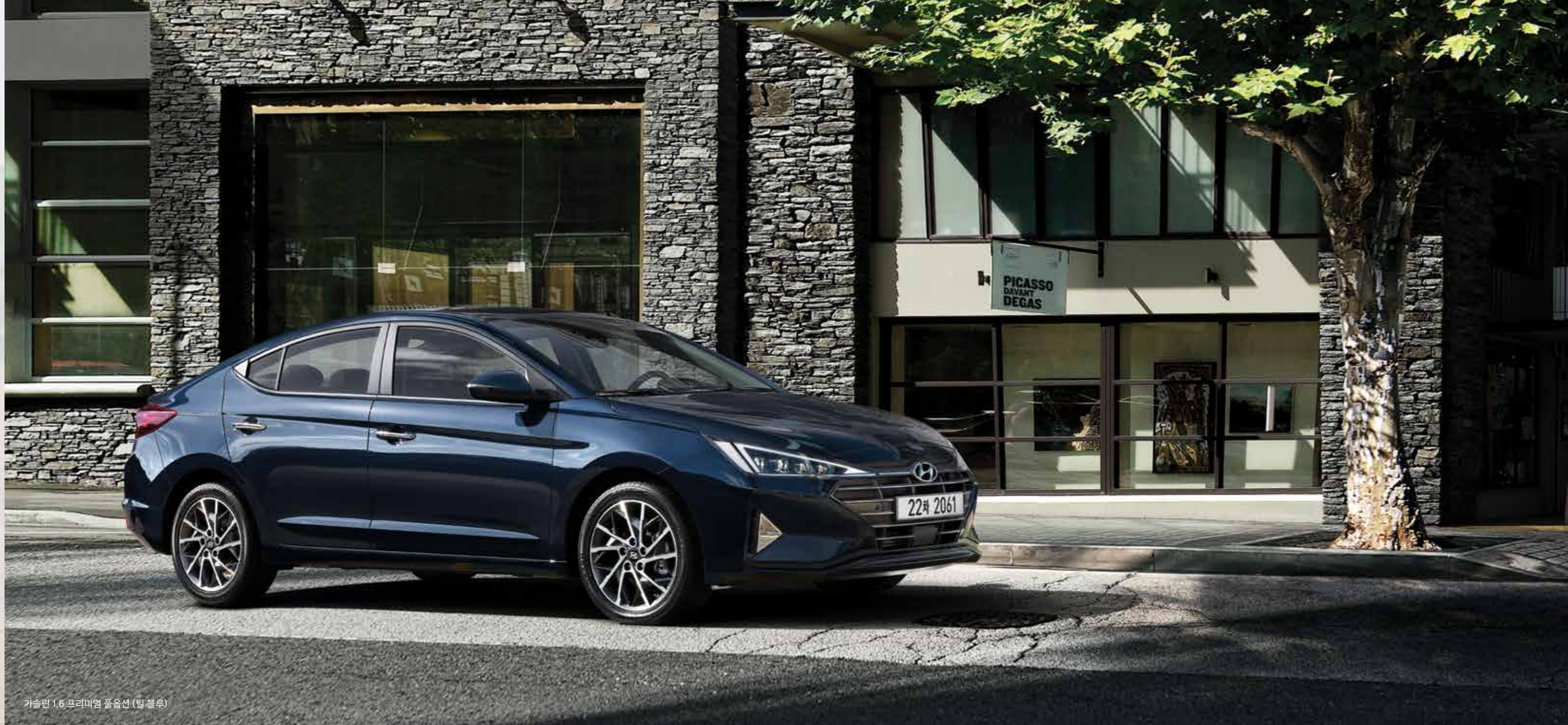
가솔린 1.6 프리미엄 풀옵션 (틸블루)

끊임없이 자기 진화하는 대한민국 대표 브랜드, 아반떼 오랜 기간 동안 많은 이들의 일상 속에서 묵묵히 그 가치를 증명하며, 준중형 시장의 기준을 제시하였습니다.