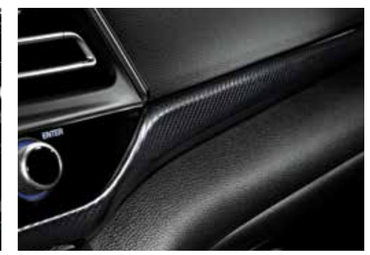
스포츠 전용 슈퍼비전 클러스터(3.5인치 단색 LCD) 카본 그레인 반편칭 가죽 D컷 스티어링 휠