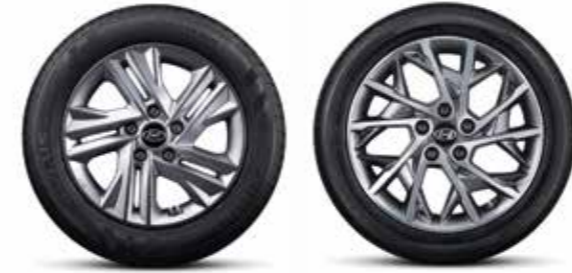
205/55R16 타이어 & 16인치 알로이 휠 / 225/45R17 타이어 & 17인치 알로이 휠