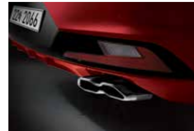
사이드실 몰딩 싱글 트윈 머플러 팁