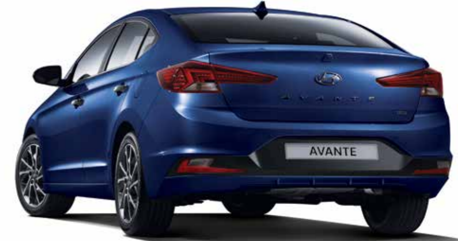
디젤 1.6 프리미엄 풀옵션(인텐스 블루)