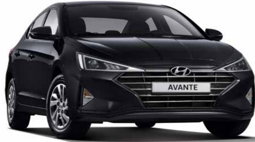
가솔린 1.6 스타일(팬텀 블랙)