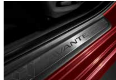
메탈 페달 메탈 도어 스커프