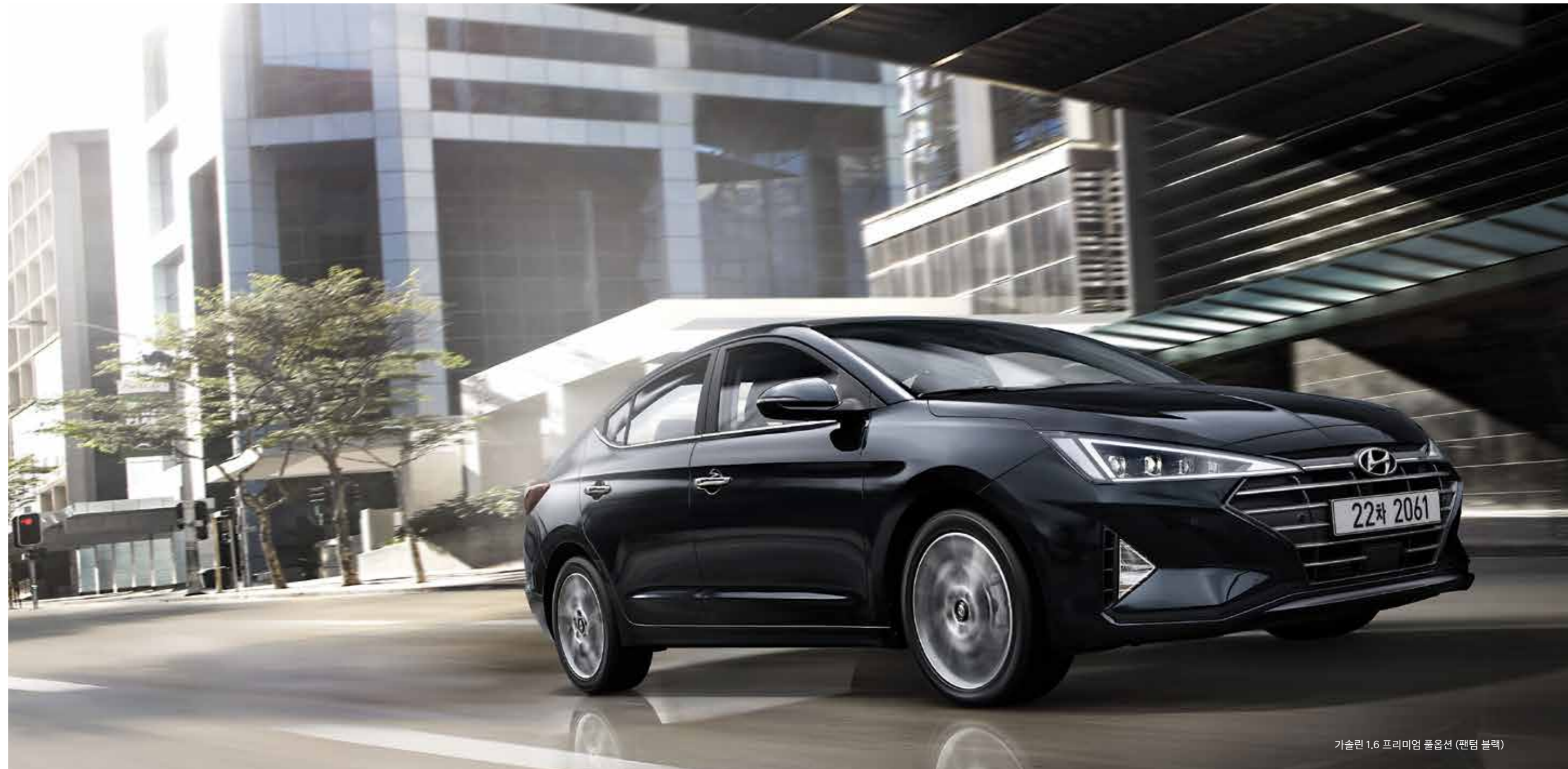
가솔린 1.6 프리미엄 풀옵션 (팬텀 블랙)