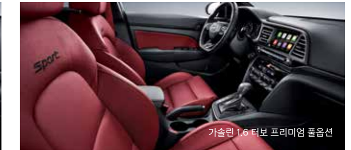
가솔린 1.6 터보 프리미엄 풀옵션