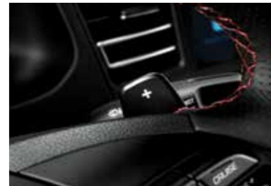
6단 수동변속기 패들 슈프트