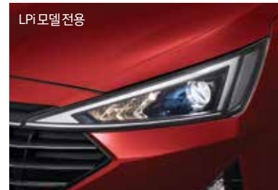
LPI 모델 전용