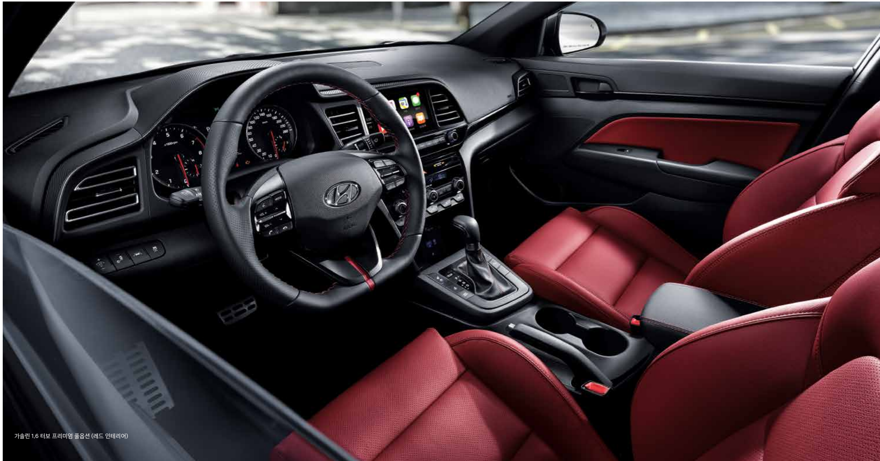
가솔린 1.6 터보 프리미엄 풀옵션 (레드 인테리어)

스포츠 모델만의 전용 버킷시트와 클러스터가 완성하는 인테리어로 파워풀한 드라이빙 감성을 느끼실 수 있습니다.