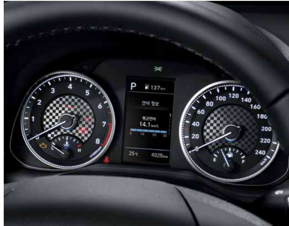
슈퍼비전 클러스터(4.2인치 컬러 LCD)

섬세하게 설계된 편의사양을 통해 당신의 드라이빙이 더욱 쉽고 편안해집니다.