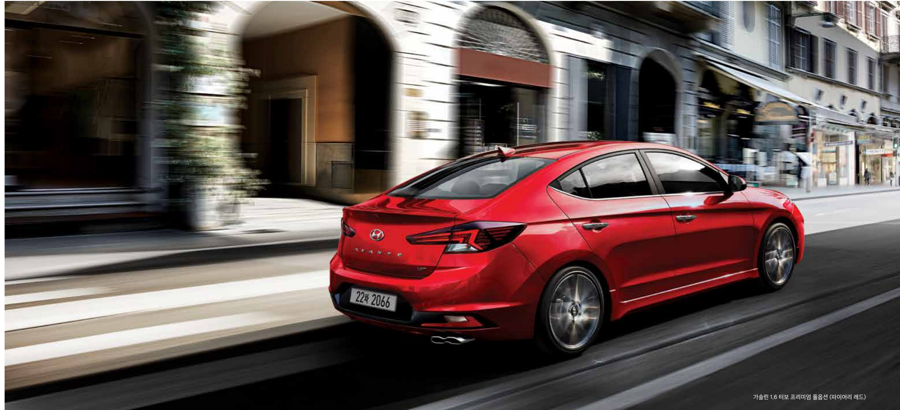
가솔린 1.6 터보 프리미엄 풀옵션 (파이어리 레드)