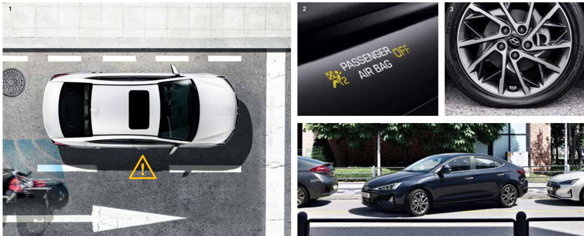
1.안전 하차 보조 - 차량 정차 후 탑승객이 도어를 오픈하는 상황에서 해당 방향 후방에서 접근하는 위험 물체를 인지하고 경고하여 문 열림으로 인한 충돌 사고를 사전에 방지해줍니다. 2.어드밴스드 에어백 - 동승석에 승객이 타지 않거나 유아 시트를 사용하여 유아를 탑승시킨 경우 등 다양한 충돌 상황에 맞게 에어백을 작동시켜 탑승객의 안전을 지켜드립니다. 3.개별 타이어 공기압 경보 장치 - 타이어 공기압이 떨어지면 클러스터 창으로 개별 타이어 공기압의 상태를 경보하여 사고를 미연에 방지합니다. 4.전/후방 주차 거리 경고 - 차량을 주차할 때 전/후방 장애물과의 거리를 단계별로 알려 줍니다.