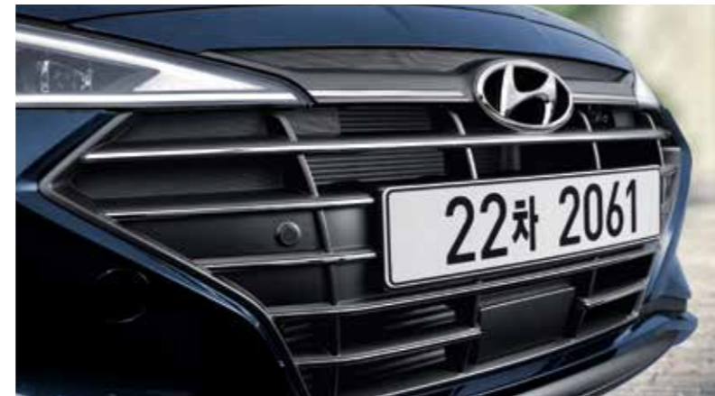
LED 헤드램프 크롬 라디에이터 그릴