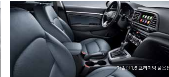
가솔린 1.6 프리미엄 풀옵션