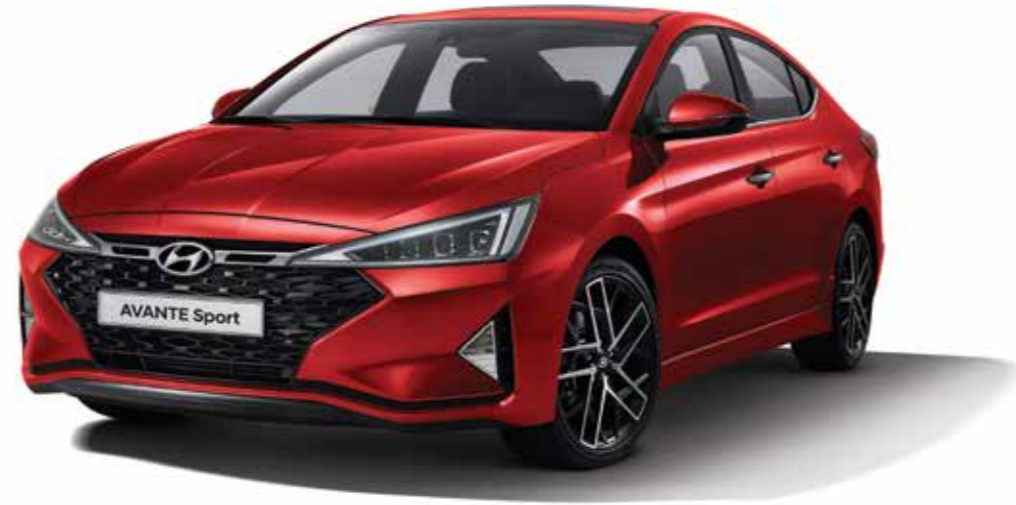
가솔린 1.6 터보 프리미엄 풀옵션(파이어리 레드)