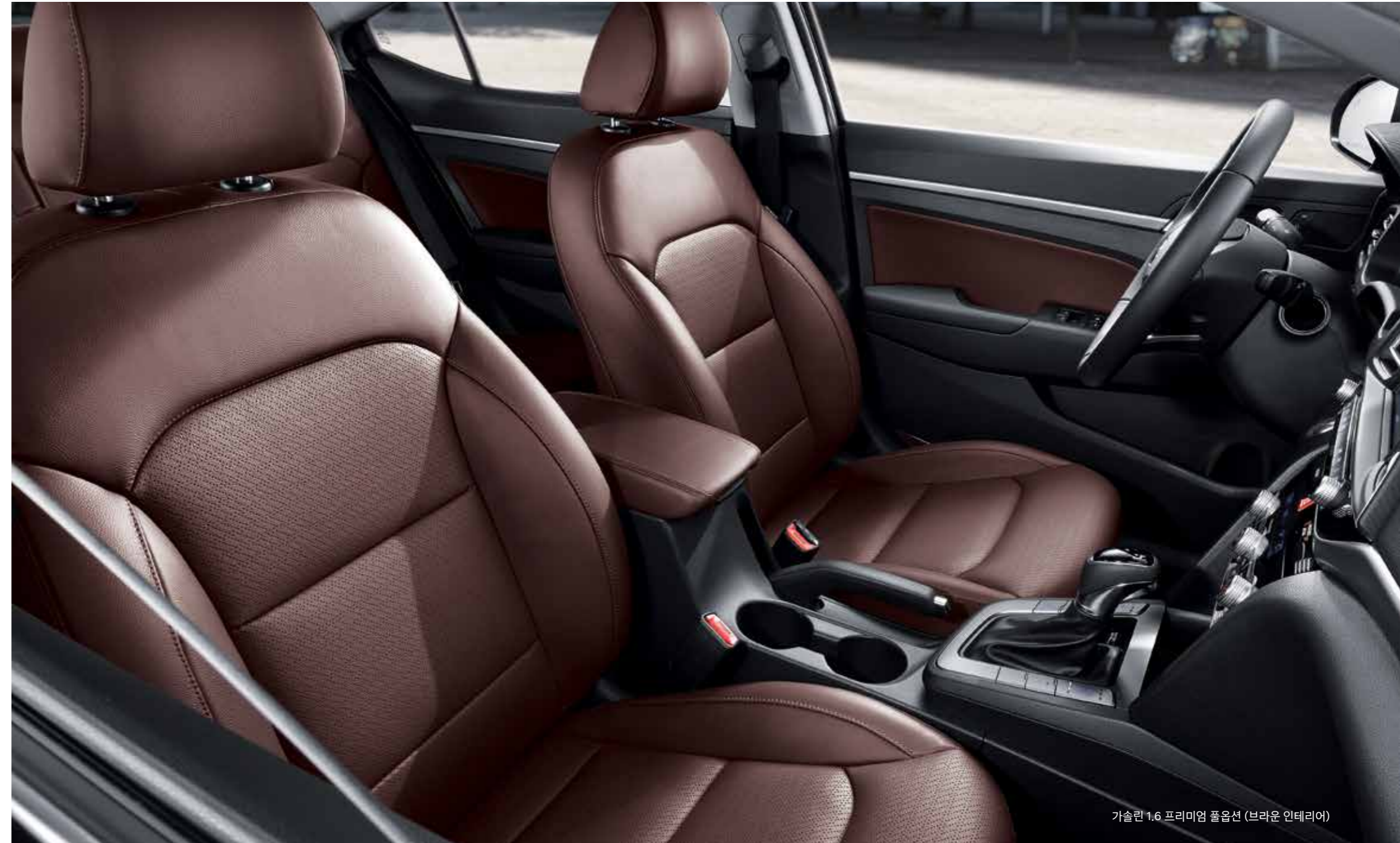
가솔린 1.6 프리미엄 풀옵션 (브라운 인테리어)