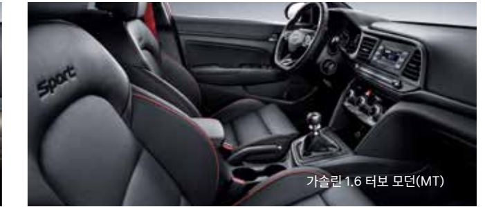
가솔린 1.6 터보 모던(MT)