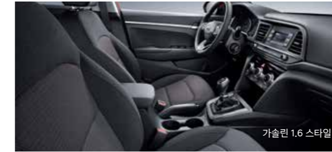
가솔린 1.6 스타일