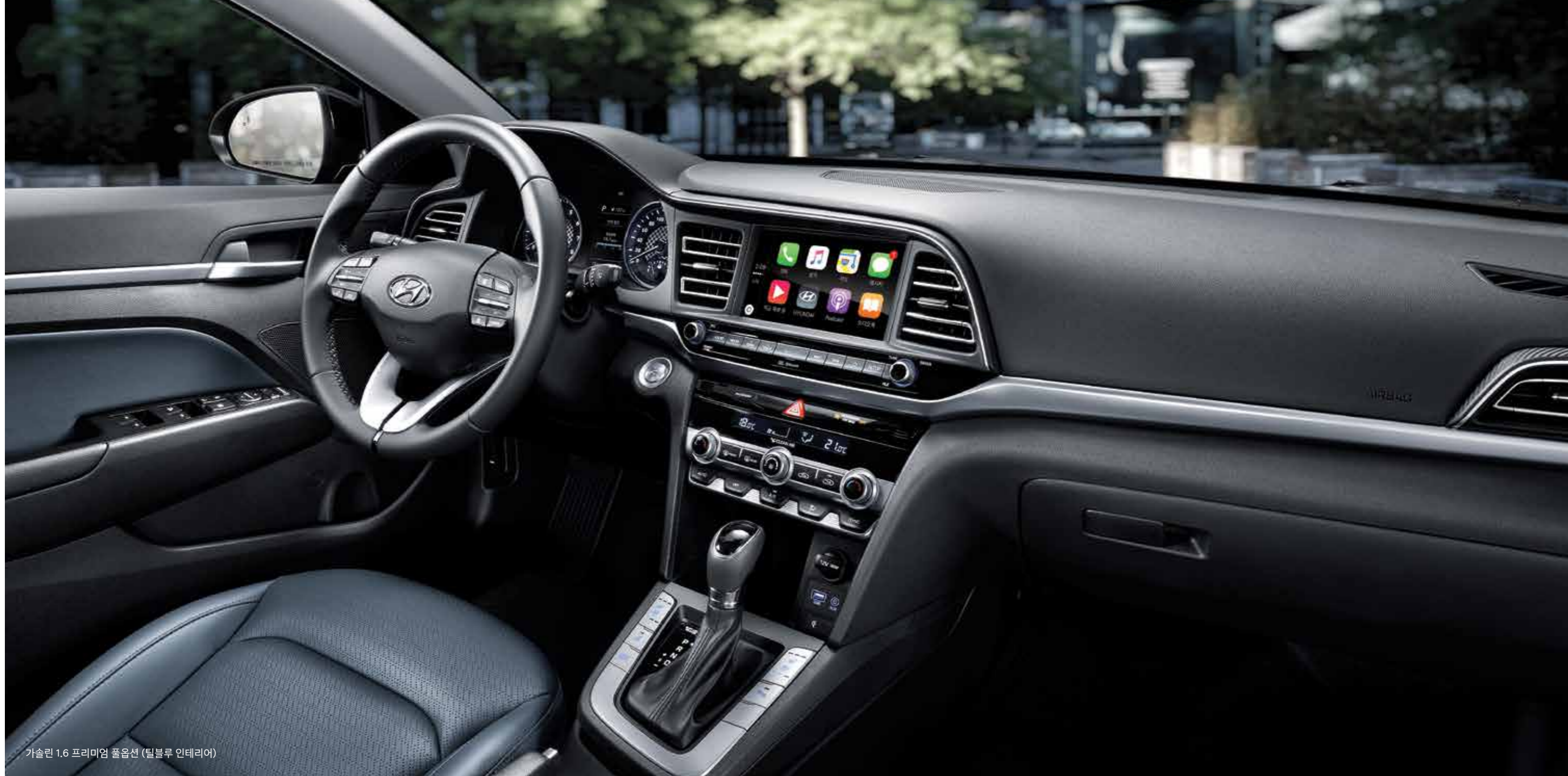
가솔린 1.6 프리미엄 풀옵션 (틸블루 인테리어)