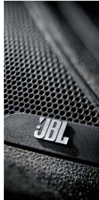
JBL프리미엄사운드(8스피커, 외장앰프 포함)