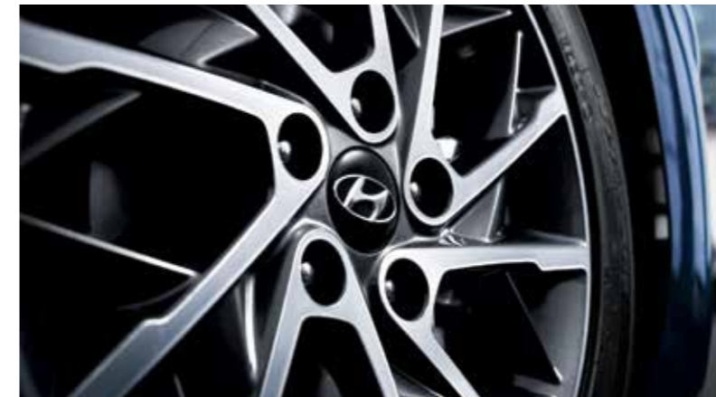
LED 리어 콤비램프 17인치 전면가공 알루미늄 휠