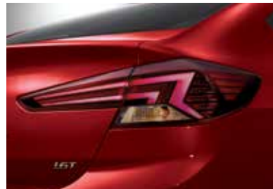
스포츠 전용 라디에이터 그릴 LED 리어 콤비램프(다크렌즈)