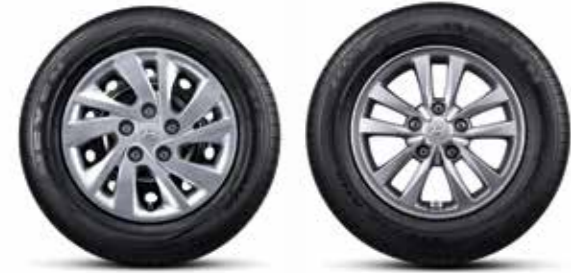
195/65R15 타이어 & 15인치 스틸 휠 & 휠 커버 / 195/65R15 타이어 & 15인치 알로이 휠