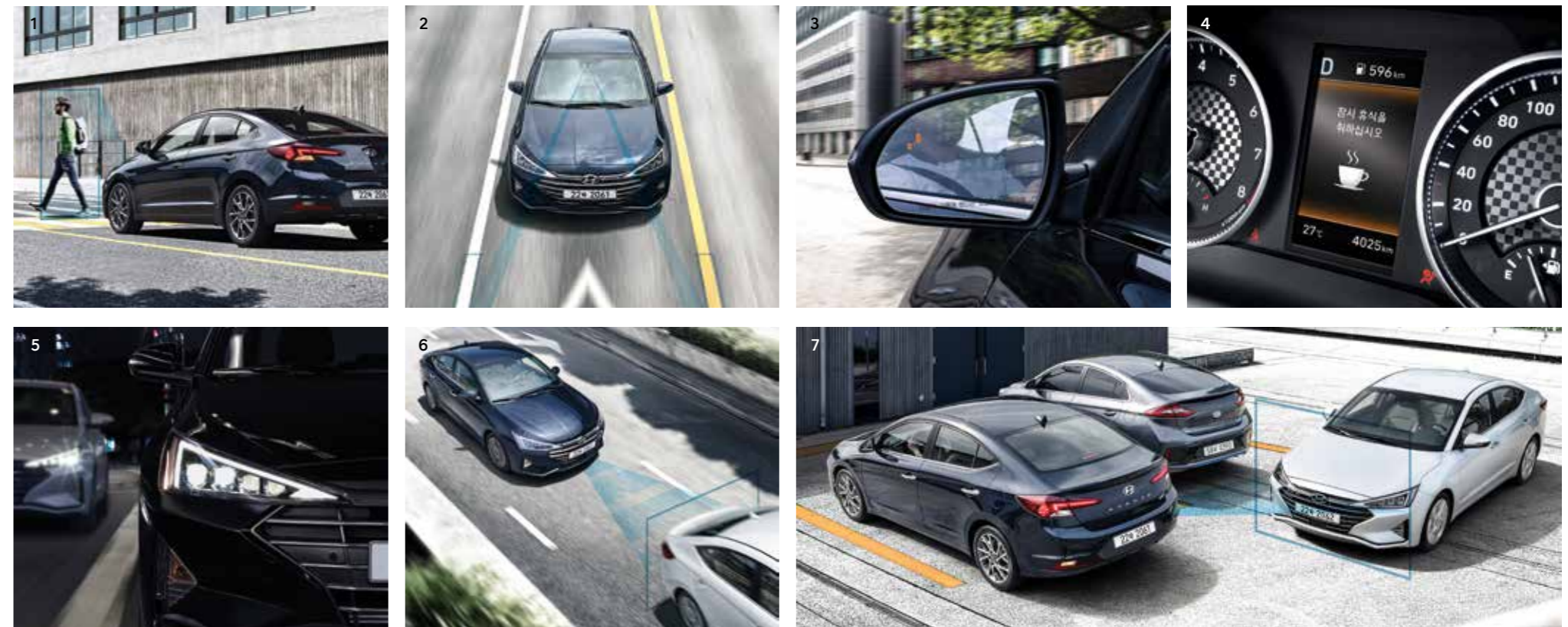
1.전방 충돌방지 보조 - 전방 감지 센서(전방 카메라 또는 전방 카메라+전방 레이더)를 통하여 전방 차량/보행자와의 거리 및 상대속도를 판단하여 충돌 위험 시 경고문 표시, 경고음 등으로 위험을 운전자에게 알려주고, 필요 시 브레이크를 작동시켜 충돌 방지를 보조합니다. 2.차로 이탈방지 보조 - 차선을 인식하고 차로 이탈이 예상되면 차로를 이탈하지 않도록 조향을 보조합니다. 3.후측방 충돌 경고 - 아웃사이드 미러로 확인할 수 없는 시야 사각지대 또는 고속으로 접근하는 차량을 인지하여 운전자에게 경고를 줌으로써 충돌사고를 예방합니다. 4.운전자 주의 경고 - 운전자의 부주의 정도를 5단계로 표시하며, 운전자의 피로나 부주의 운전이 판단되면 메시지와 경고음을 통해 휴식을 권유합니다. 5.하이빔 보조 - 야간에 상황등을 켜고 주행하는 중 맞은편 또는 앞쪽에 차량이 있을 경우 헤드램프를 하향등으로 자동 전환하여 잦은 상황등 조작에 따른 불편함을 줄여주고 운전차량 및 상대차량이 안전하게 주행할 수 있도록 도와줍니다. 6.스마트 크루즈 컨트롤 - 가속페달을 밟지 않아도, 차량의 속도를 일정하게 유지시켜주고 전방의 차량을 감지하여 운전자가 설정한 속도와 앞차와의 거리를 유지시켜 주는 편의 장치입니다. 7.후방 고차 충돌 경고 - 후방 출차 시 측방에서 접근하는 차량을 인지하여 경고를 주어 충돌 사고를 예방합니다.