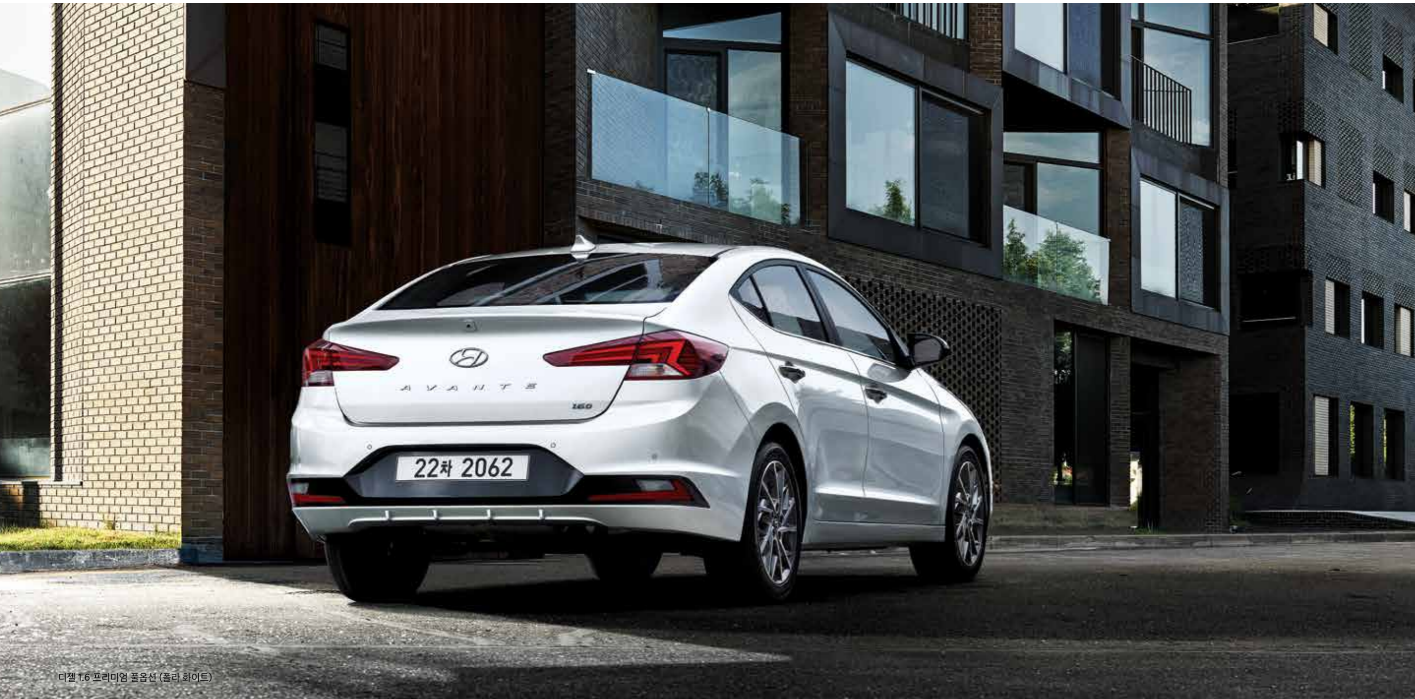
디젤 1.6 프리미엄 풀옵션 (플라 화이트)

탄탄한 자세가 주는 안정감과 변화가 느껴지는 디테일의 조화로움은 당신의 섬세한 취향을 말해줍니다.