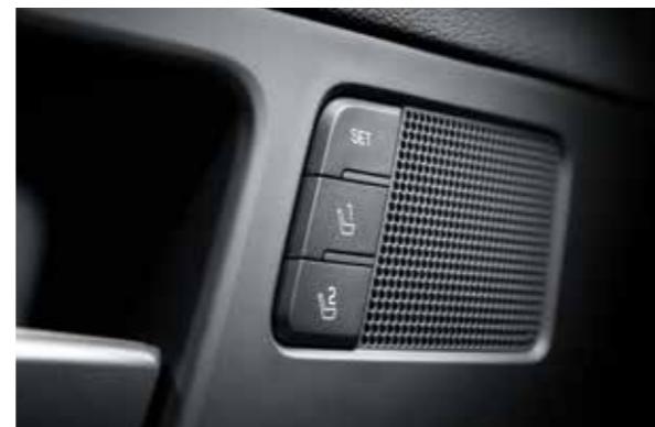
스마트폰 무선충전 / 운전석 자세 메모리 시스템(IMS)