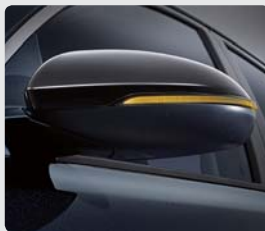
블랙 아웃사이드 미러