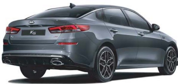
1.6 가솔린 터보 노블레스 스페셜