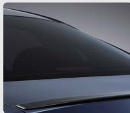
블랙 리어 스포일러