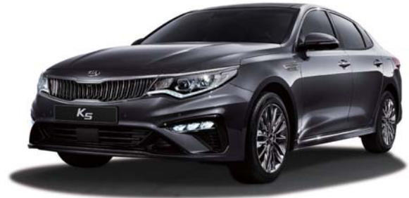
2.0 가솔린 인텔리트렌드