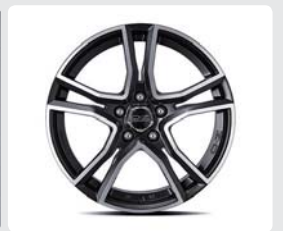
18인치 OZ 경량 휠